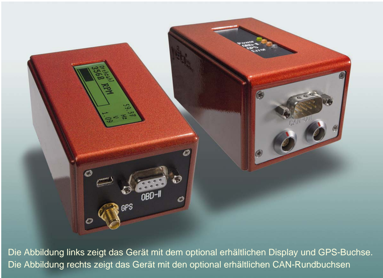
Die Abbildung links zeigt das Gerät mit dem optional erhältlichen Display und GPS-Buchse. Die Abbildung rechts zeigt das Gerät mit den optional erhältlichen CAN-Rundbuchsen

Das über den ISO-Standard 15765 genormte OBID2-Protokoll, ermöglicht einen komfortablen Zugriff auf die vom Fahrzeugsteuergerät bereitgestellten Sensorwerte.